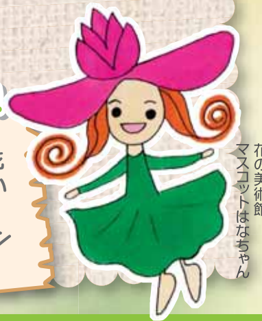
花の美術館 マスコットはなちゃん

アトリウムは、四季おりおりの花と緑が館内いっぱいにあふれています! 温室は大きなヤシや鮮やかなランなどトロピカルムードたっぷり!